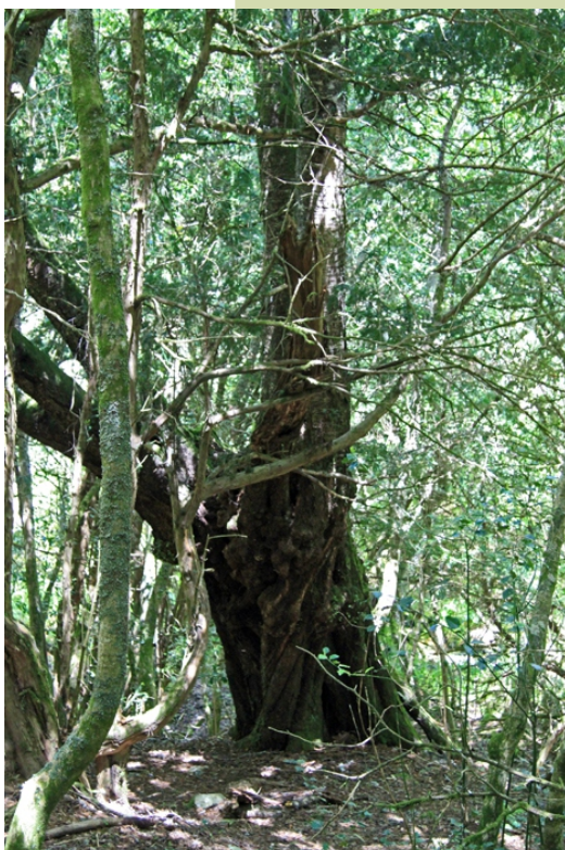
Bidueiro de case 4 m de perímetro no Teixidal.