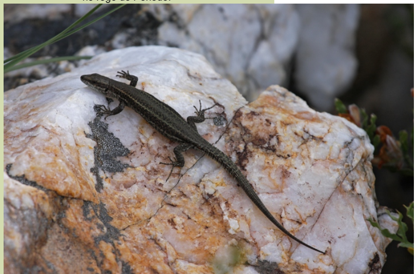
Lagartixa dos penedos ( Podarcis hispanica )