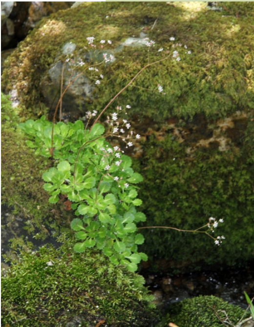
Saxífraga e brión na beira do río.