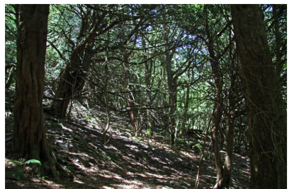
Interior do Teixidal.