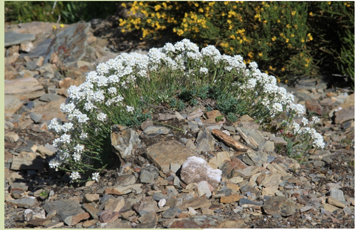
Teesdaliopsis conferta , endémica das montañas do noroeste da Península Ibérica.