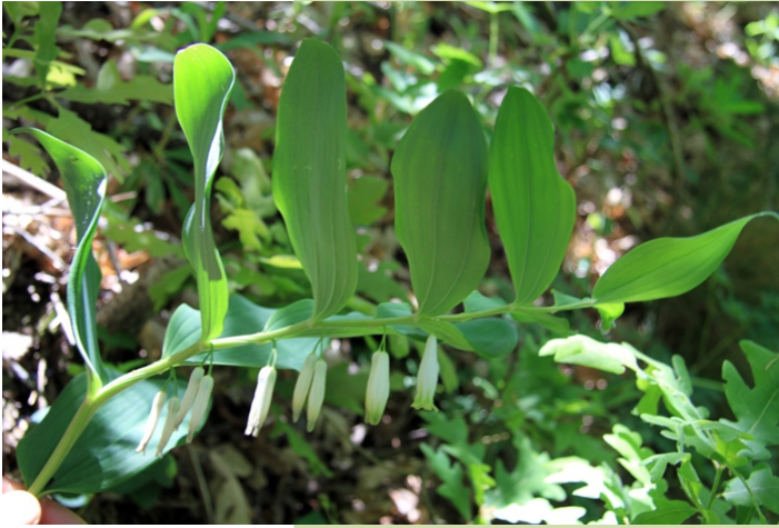
Soldaconsolda ( Polygonatum odoratum )