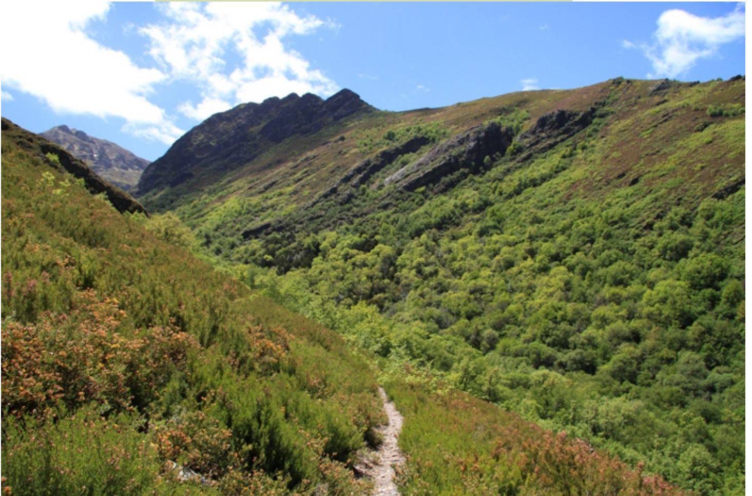
Chegando ao Teixidal.