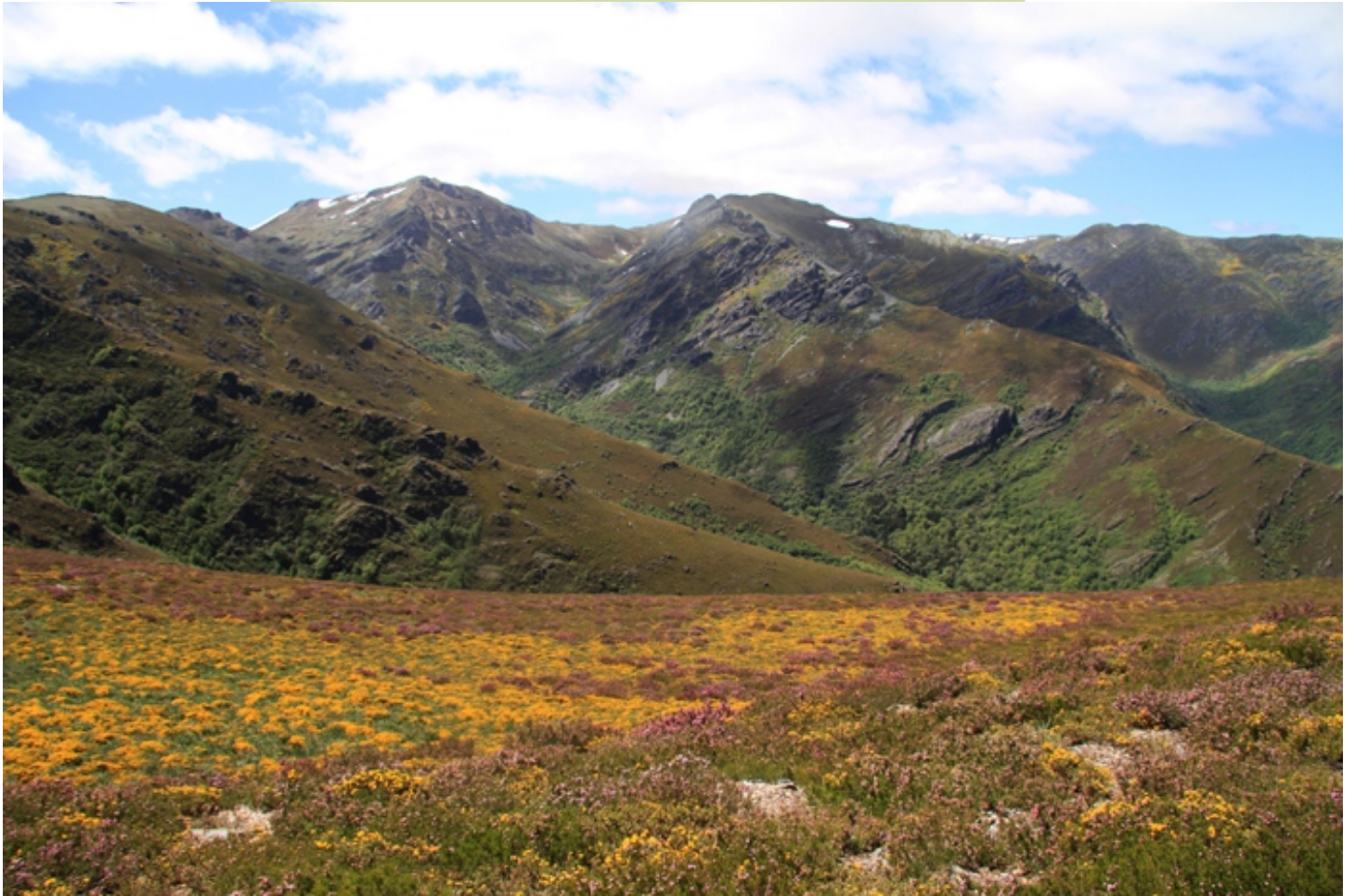
O Teixidal e Pena Survia, desde A Cabrita.