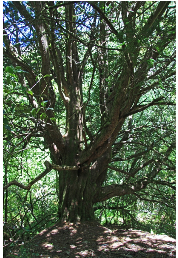
Un dos vellos teixos, con máis de 4 m de perímetro.

Outra opción, máis longa, sería volver polas minas de Valborraz.